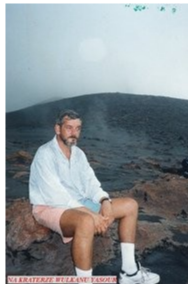
NA KRATERZE WULKANU FASOUA

Krater o średnicy około kilometra, obsypany szaro-czarnym piargiem usypiska zapadał się w dół stromym, prawie pionowym stokiem na głębokość 200-300 metrów. W dole kipiało 6-7 osobnych kraterów, pulsujących na zmianę, lawą z dymem, bulgocząc jak przypalająca się grochówka, by wybuchnąć rykiem pary, lawy i glutami rozpalonej do białości płynnej skały o wielkości sporych wagonów tramwajowych.